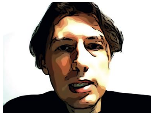
BORIS LE LAY

Nationaliste breton d'extrême droite, Le Lay s'est fait une réputation à la fin des années 2000 en faisant des vidéos outrancièrement antisémites et en publiant sur son site Breizatao des insanités qui lui vaudront plusieurs condamnations pour incitation à la haine raciale. Obligé de fuir au Japon, il animait un des pires sites du genre, Démocratie participative, aujourd'hui bloqué.