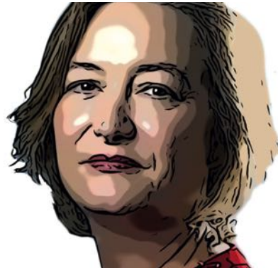
LUDOVINE DE LA ROCHÈRE

C'est en 2013 que Ludovine de la Rochère s'est trouvée une vocation en devenant présidente de La Manif Pour Tous. Le modèle familial qu'elle y défend est à l'image de sa famille politique : rigide, inégalitaire et tourné vers le passé. Elle s'entête à animer son mouvement, bien que n'attirant quasiment plus que des cathos issus de l'aristocratie, qui lui ressemblent, forcément.