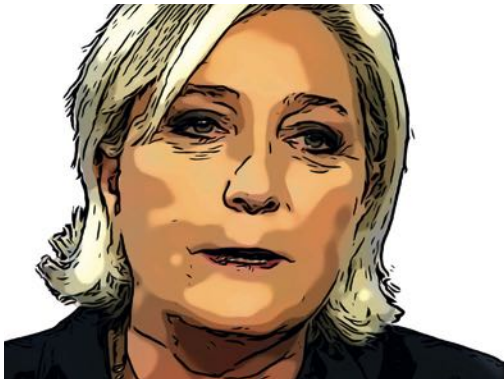
MARINE LE PEN